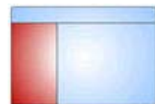
Panel de contenidos

Los resultados de la búsqueda se presentan en la ventana izquierda o panel de contenidos. Las bases de datos están divididas en secciones. Cada base de datos presenta el número de documentos recuperados seguido del número total de documentos contenidos. Para visualizar los títulos de las secciones es necesario hacer clic en la base de datos/sección deseada.