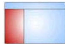
Panel de contenidos

DARE (Database of Abstracts of Reviews of Effectiveness). Base de datos de resúmenes de revisiones de eficacia. Está producida por la NHS Centre for Reviews and Dissemination, dependiente de la Universidad de York (Reino Unido).